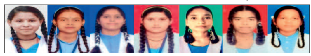
►► तैदूकोना