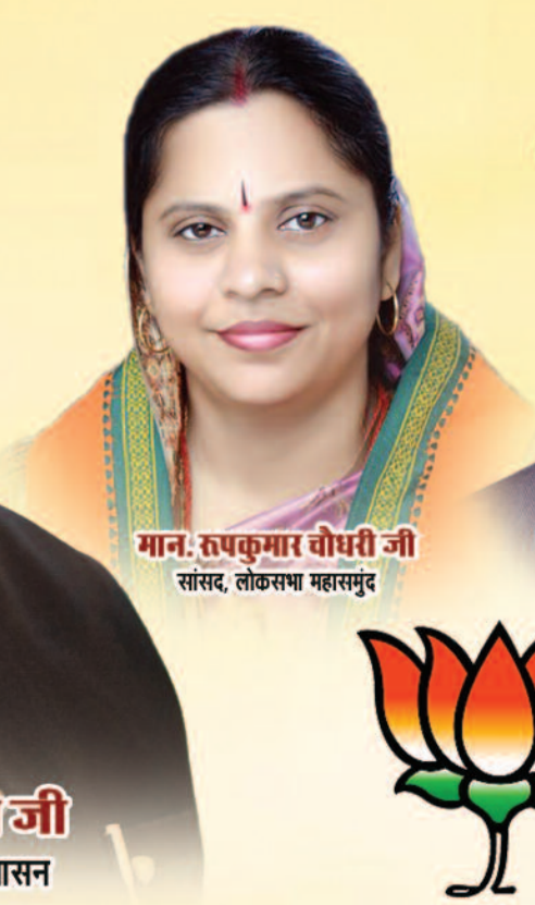
मान. रुपकुमार चौधरी जी सांसद, लोकसभा महासमुंद