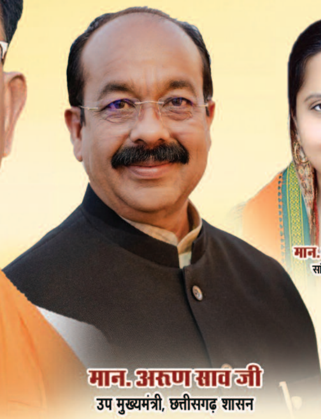
मान. अरुण साव जी उप मुख्यमंत्री, छत्तीसगढ़ शासन