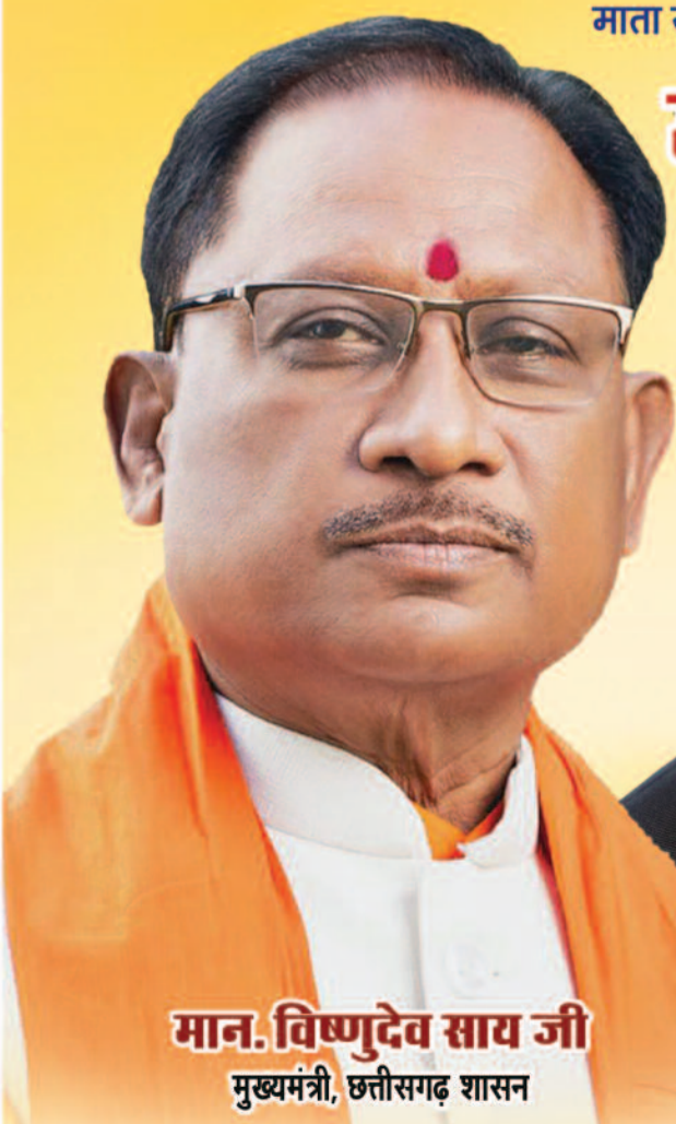
मान. विष्णुदेव साय जी मुख्यमंत्री, छत्तीसगढ़ शासन

मान. अरुण साव जी का स्वागत..वंदन..अभिनंदन..