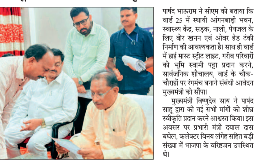
हरिभूमि न्यूज ►► पिथौरा (गामीण)

वार्ड शासकीय भूमि पर गरीब परिवारों के प्रधानमंत्री आवास बनाकर उनके लिए पक्के आवास की सुविधा उपलब्ध कराना जा सकता है। जिसके लिए स्वीकृति देने का निवेदन किया। इसके अलावा वार्ड में विभिन्न विकास कार्यों व मांगों से भी उन्हें अवगत कराया।