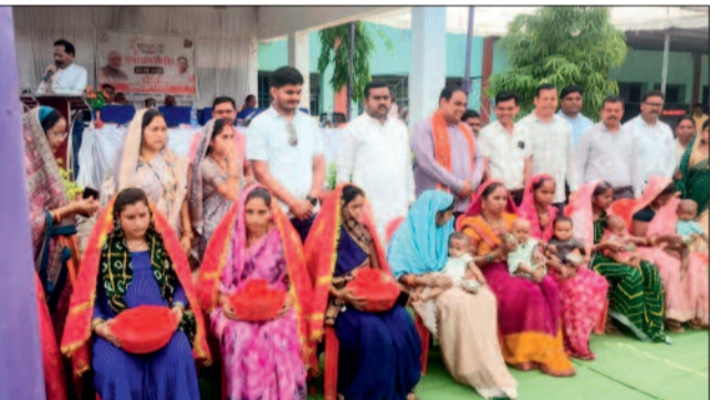
हरिभूमि न्यूज ►► बसना

जनपद पंचायत बसना अंतर्गत बड़ेसाजापाली में सुशासन तिहार अंतर्गत समाधान शिविर का आयोजन किया गया। शिविर में शासन की विभिन्न