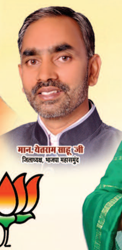
मान. येतराम साहू जी जिलाध्यक्ष, भाजपा महासमुंद